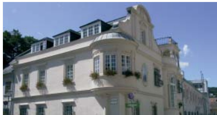
Aussenansicht Landesmuseum Burgenland