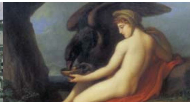
Angelika Kaufmann, Ganymed und der Adler, 1793