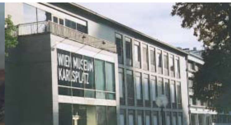
Aussenansicht Wien Museum Karlsplatz