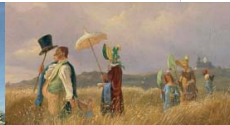
Carl Spitzweg, Der Sonntagsspaziergang, 1841 (Ausschnitt)